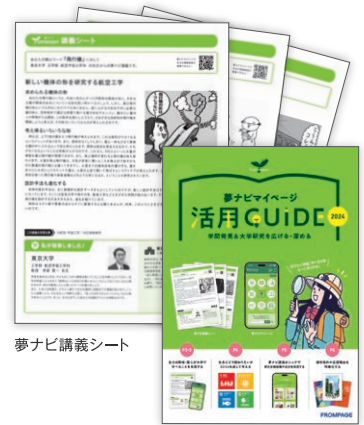
夢ナビ講義シート

※関心ワード・SDGs登録用サイトで登録する「夢ナビのパスワード」と郵便番号で、「夢ナビマイページ」にログインできます。