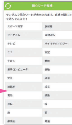
ランダム関心ワード画面