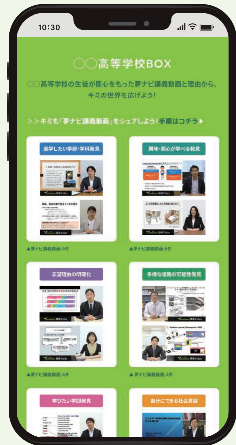
夢ナビマイページ 貴校専用学校BOX