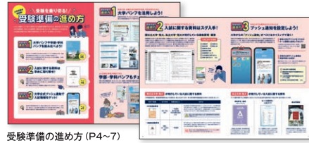
受験準備の進め方 (P4~7)

ネット出願の拡大と合わせて、入試情報を公式サイトなどで確認する機会が増えていますが、多くの大学・短大が募集要項・入学試験要項などの「入試に関する資料」を発行しています。大学が発行している資料を利用した安心で確実な出願準備をご指導ください。[P4~7をご参照ください]